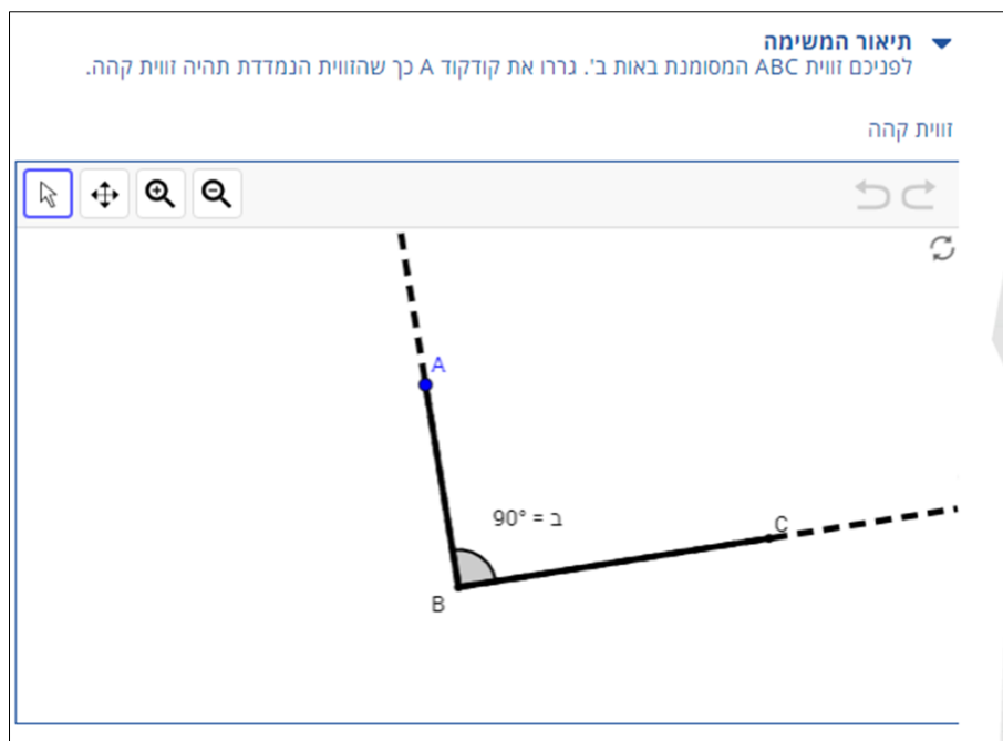
איור 1: היישומון.

ביישומון מוצגת זווית \sphericalangle ABC (איור 1). זווית זו מוצגת במצב ההתחלתי כזווית ישרה המסומנת באות ב'. הקודקודים C ו-B מקובעים ואינם ניתנים להזזה. ניתן להזיז את קודקוד A (מסומן בכחול) וליצור זוויות בין 0-360 מעלות. מכיוון ששתי קרניים יוצרות שתי זוויות. היישומון מסמן רק אחת מהן. זווית זו היא הזווית שבה מגיעים מהקרן BC לקרן BA נגד כיוון השעון. זווית זו מסומנת בקשת והיא הזווית הנמדדת.